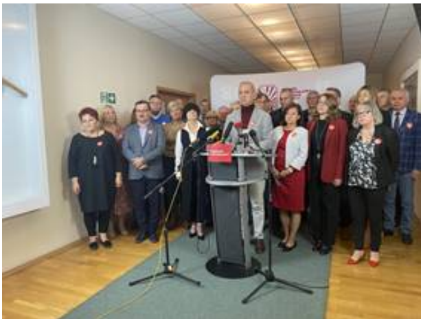
List ZNP do Premiera RP ws podwyżek dla nauczycieli i rozbieżności między projektem budżetu a deklaracjami MEiN.

5 września 2022 r. na konferencji prasowej prezes ZNP Sławomir Broniarz zwrócił uwagę na rozbieżności w danych, które przedstawił minister edukacji i nauki Przemysław Czarnek w zderzeniu z projektem budżetu państwa na rok 2023.