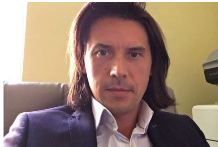
Pandemia. Nowa rzeczywistość? – pod takim tytułem Rada

Szkołnictwa Wyższego i Nauki ZNP zorganizowała webinarium, podczas którego akademicy – członkowie Związku starali się odpowiedzieć na pytania o długofalowe skutki pandemii dla gospodarki, polityki i społeczeństwa. Jaka idea towarzyszyła organizacji tego wydarzenia?