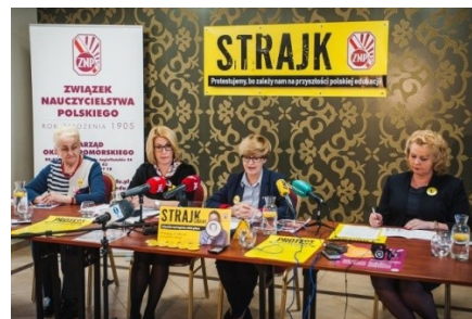
Interpelacja w sprawie planowanych zmian w ustawie KARTA NAUCZYCIELA - 3 02.2021r.

Kolejny minister powalczy z kartą. Jak mogą się zmienić zarobki nauczycieli - GazetaPrawna.pl